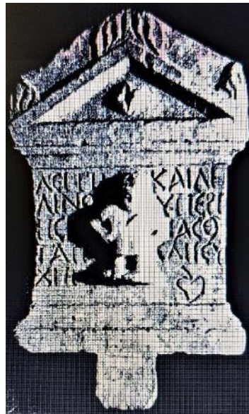
Asal 2002, Nr. 26, Taf. 15 Abb. 2