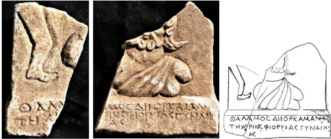
Zeichnung: Varinlioğlu, I.Uşak Museum , 60 Nr. 79.

Θάλαμος Διὸρκαμαν[ι]- 2 τη χάριν ἐφιορκίας γυναικ[ι]- ας.