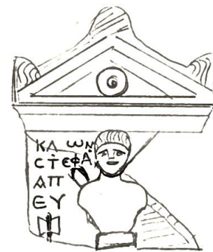
Zeichnung: Varinlioğlu, I. Uşak Museum , 24 Nr. 23