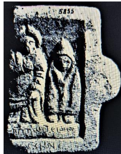
Asal 2002, Nr. 28, Taf. 16 Abb. 2

Nr. 26 (kleine Giebelstele aus Marmor; Inv. Nr. 5969, Taf. 15 Abb. 2): Λείτη καὶ Λίλινο<ς> ὑπὲρ | τῆς (sic) ἰ<δ>ίας θε<ου> | γατέρ<ο>ς Διὶ εὐχὴν. ✱.