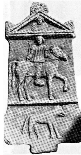
b. Drew-Bear &amp; Naour 1990, 1937, Nr. 8 Taf. IV

Apellas, der Sohn des Onesimos, dem Apollon als Gelübde.