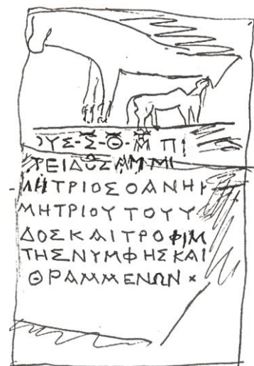
Zeichnung: E. Varinlioğlu