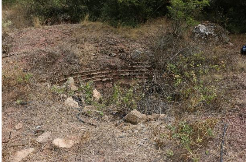
Fig. 2. Arapuçtu Kule Kalıntısı

puçtu mevkiinden gelen yolun tam üzerinde yer alan bu höyük üzerinde bulunan çok sayıda Roma ve Geç Dönem keramiği de burada büyük bir yerleşim olduğunu gözler önüne sermektedir. Bu durumda Göktepe Höyük Mansio Mido/Moedo 15 Orientis olarak adlandırmak yanlış olmayacaktır (Fig. 3; ayrıca bk. Fig. 6).