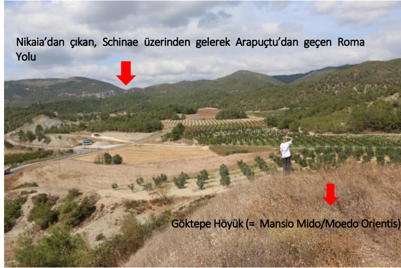
Fig. 3. Göktepe Höyük'ten (Moedo Orientis / Mansio Mido) Arapuçtu'na Bakış

Bu yerleşimden sonra ikiye ayrılan yol karşı kıyıya, biri Sakarya üzerinden diğeri de Göksu üzerinden olmak üzere iki farklı köprü ile geçilebilmektedir. Göksu üzerinden geçen köprü, Leukai'a (= Lefke) oradan Bilecik (= Belokomis) ve oradan da Türkiye'nin güney sahillerine doğru yönelmekteydi. Sakarya üzerindeki köprü ise Selçik köyüne ait Karabağlar mevkiine ve oradan da Tataion (= Gölpazarı), Iuliopolis (= Nallıhan), Ankyra (= Ankara), Antiokheia (= Antakya) ve buradan devamlı Kudüs'e gitmekteydi. Selçik köyü Karabağlar mevkiine giden yolun devamında ise Sakarya'yı aşmak için adını bilmediğimiz bir köprü daha bulunmaktaydı. Yayınlarda yer almayan bu köprüye