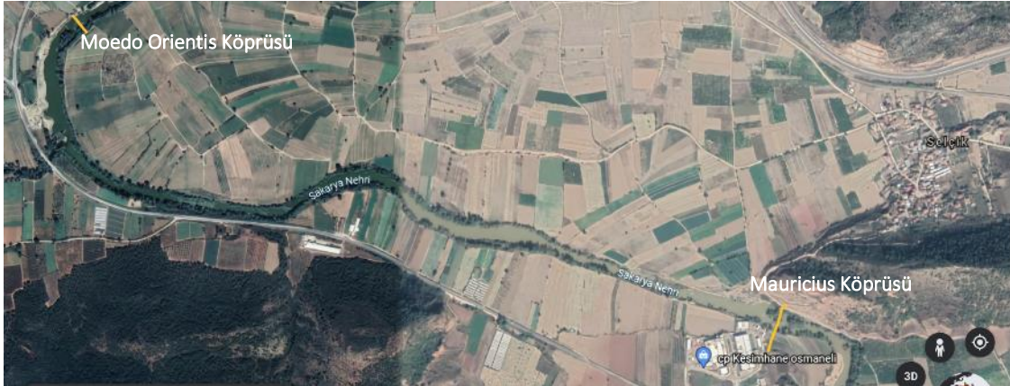
Fig. 6. Moedo Orientis ile Mauricius Köprüsü

Büyük olasılıkla bu depremlerden birinde yıkılmış olan Moedo Orientis'in yerine yapılan Mauricius Köprüsü daha sonra Doğu'ya gidecek olan Roma ordularının yeni güzergahı haline gelmiş olmalıdır (Fig. 6). Sakarya'nın doğu yakasındaki ayaklarına ait taşıyıcılardan sadece ikisinin (Fig. 7) temel izleri kalan köprünün Selçik köyü tarafındaki ayağından (Fig. 8) devam eden yol, Selçik Tepesi'nin güneybatısından (Fig. 9) kıvrılarak Osmaneli ilçesine Medetli köyüne doğru yönelmiş olmalıdır. Şimdilik buradan geçtiğini düşündüğümüz Roma yoluna ait herhangi bir izle rastlanmamıştır. Bununla birlikte yolun geçtiğini tahmin ettiğimiz Selçik Tepesi'nin güneybatı yamacındaki bu güzergah üzerinde çok sayıda Geç Dönem'e ait yapı kalıntılarının izleri yer almaktadır.