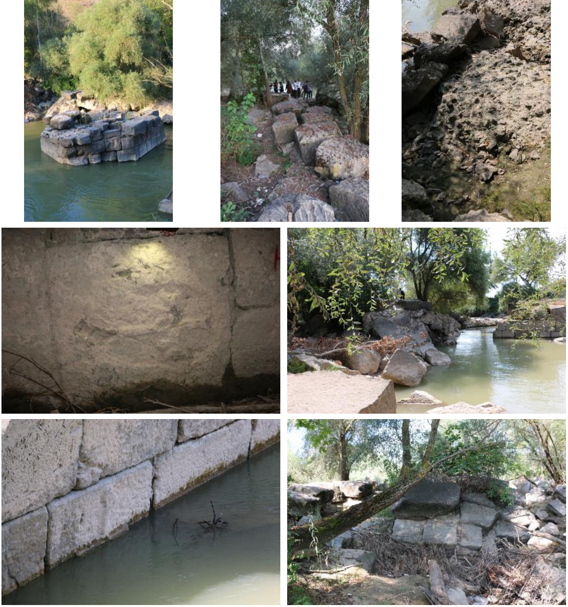
Fig. 8. Mauricius Köprüsü'ne ait, Sakarya Nehri üzerinde yer alan adacıktaki kalıntılar

Şimdilik yapım tarihi ve tekniği hakkında çok kesin bir şey söyleyemediğimiz bu köprü ve devamındaki Roma yolları üzerindeki çalışmalarımız sürmektedir. Çalışmalar devam ettikçe, bölgenin köprüleri, yol ağları ve yerleşim coğrafyası hakkındaki bilgilerimizin artacağından kuşku yoktur.