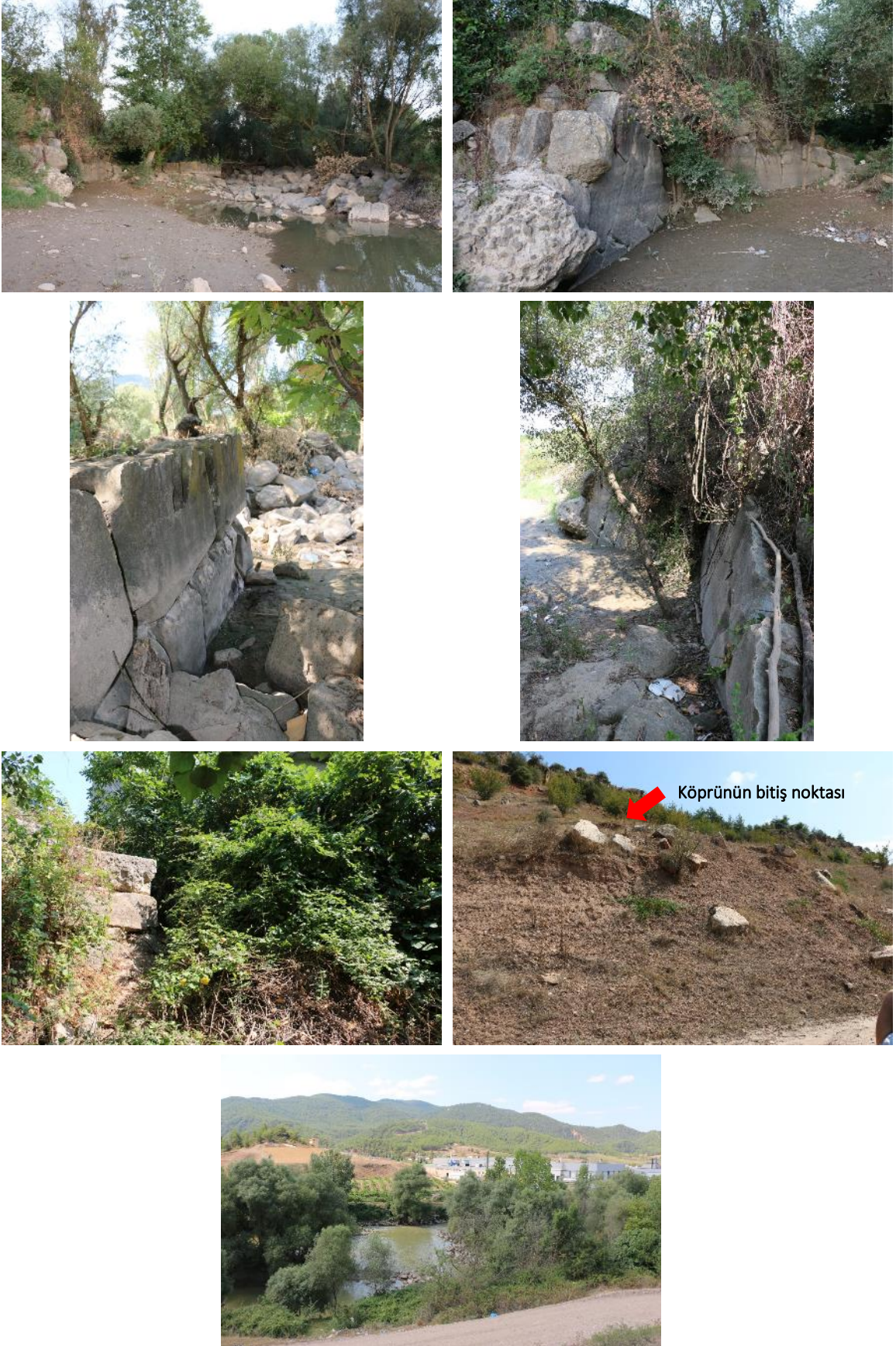
Fig. 9. Mauricius Köprüsü'ne ait, Selçik köyü tarafındaki kalıntılar