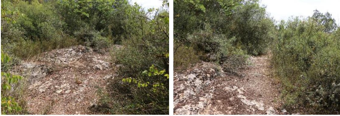
Fig. 1. Arapuçtu Roma yol kalıntısı başlangıç

Buradan devam eden Roma/Hac Yolu Bilecik ilinin Osmaneli ilçesinin Düzmeşe köyündeki sınırları içindeki Arapuçtu'dan geçmektedir (Fig. 1). Burada Fındıklı mevkiinde kayaların kesilmesiyle başlayan Roma yolu yaklaşık 70 m uzunluğunda ve 4 m genişliğindedir. Yolu içinde araba tekerleklerinin oluşturduğu derin izler görülmekle; ancak yol, 70 m sonra aniden kesilmekte ve topraklı bir alan başlamaktadır. Kayaların açılmasıyla yapılan yolun hemen hemen başlangıç noktasında olasılıkla bir gözetleme kulesine ait temel izleri yer almaktadır (Fig. 2). Ayrıca yine bu mevkiideki bir tarla içinde, Düzmeşe köyü sakinlerinden birisi olan Yener Özyılmaz tarafından İmparator Vespasianus'a tarihlenen ait altı kırık bir mil taşı bulunmuştur (bk. 1 numaralı yazıt). Bilindiği üzere imparator Vespasianus zamanında Küçük Asya'da geniş çaplı bir yol onarım çalışması başlatılmıştır. Bithynia et Pontus Eyaleti 'nde de bu görevi eyalet procurator 'u L. Antonius Naso üstlenmiştir. Olasılıkla bu mil taşının kırılmış yerinde de Naso'nun adı geçmekteydi. Zira yakın zamanda Nikaia egemenlik alanında bulunan ve tarafımızdan yayımlanmamış bir başka miltaşında İmparator Vespasianus, Titus ve Domitianus ile birlikte Naso'nun adı da geçmektedir 12 . Söz konusu yazıtta göre, Naso Nikaia'dan Iuliopolis'e ve oradan Ankyra'ya giden yolun tamirini üstlenmiştir. Yine başka yazıtlar aracılığıyla, Naso tarafından Prusa, Kios, Tieion ve Sinope kentlerinin egemenlik alanında tamir ettirdiği yollar bilinmektedir 13 .