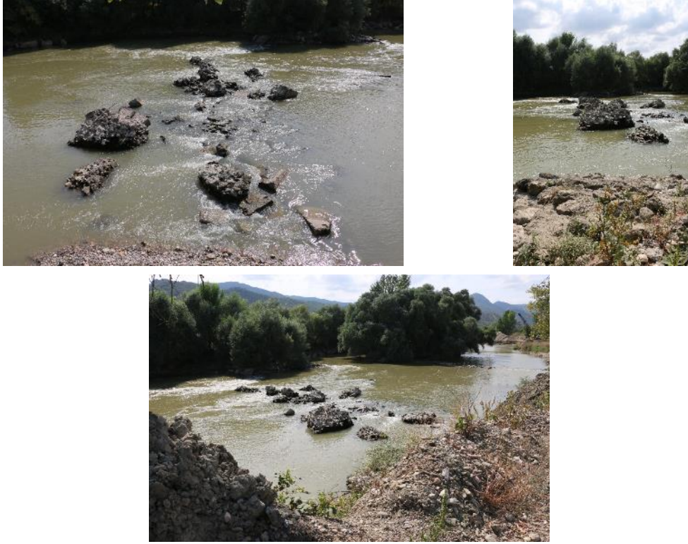
Fig. 4. Moedo Orientis Köprüsü'ne Ait Kalıntılar (Denekönü mevki)

ait birkaç temel kalıntısı, ancak su seviyesinin en aza indiği dönemlerde kısa süreli olarak görülebilmektedir (Fig. 4). Adı bilinmeyen bu köprüyü, bulunduğu konumdan ötürü Moedo Orientis olarak adlandırmaktayız. Birazdan aşağıda anlatacağımız nedenlerden ötürü MS IV. yüzyılda yıkıldığını düşündüğümüz bu köprünün yerine, başka bir alana yeni bir köprü yapılmış ve yolun yönü değişmiş olmalıdır. Selçik köyü sınırları içinde kalan bu yeni köprünün kalıntılarında birinin üzerinde İmparator Mauricius'un (MS 582-602) monogramı yer almaktadır (bk. 3 numaralı yazıt).