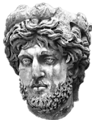
Özdizbay 2010, 203 res. 1.

Str. 4-7: Söz konusu satırlar, Cn. Pedanius Valerianus'un, kentte düzenlenen gladyatör dövüşlerinin ihtiyaçlarını karşıladığını belirtir. Buradaki tamamlama önerileri için Gortyn 39 , Miletos 40 , Sagalassos 41 ve Apollonia'dan 42 ele geçen yazıtlar dayanak oluşturmaktadır. Str. 4-5'de söz konusu dövüşlerin kaç tam gün süreceği bildirilmektedir. Bu tür gösterilerin gerçekleştiği gün sayısı ge-